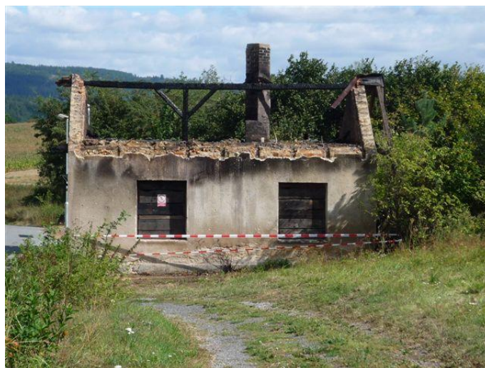
Tak teď vidí naši vesnici cestující z oken vlaku. Škoda.