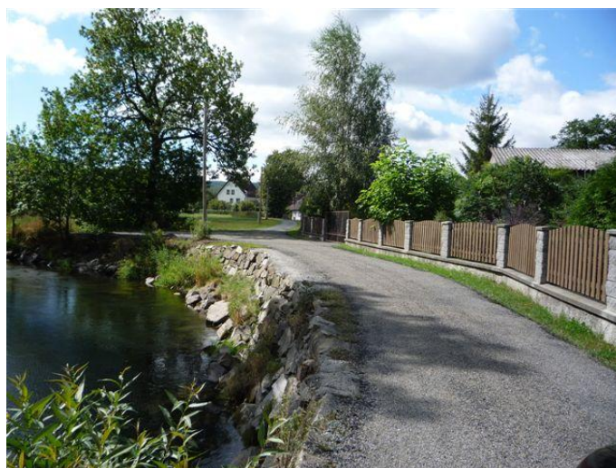
Během léta se podařilo opravit kyselku a několik uliček v Zátoru i v Loučkách. Děkujeme všem občanům, kteří si upravili nájezdy ke svým domům.