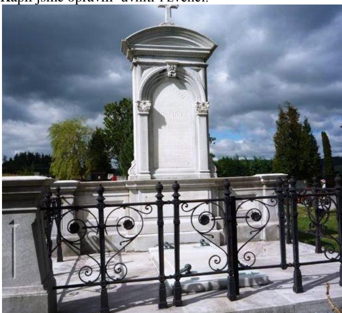
Pan Gromnica vrací starobylým hrobkám dávno krásu.