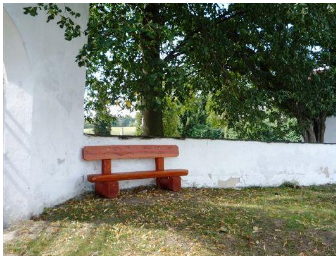
Díky panu Kolářovi můžete obdivovat nádherný výhled.