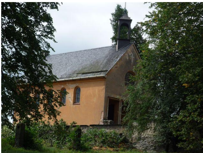
Stará třešeň už kapli neohrožuje. Okapy jsou nové.

Tento nápis vítá příchozí na mnohých hřbitovech. Je naší povinností starat se i o místo posledního odpočinku s péčí dobrého hospodáře.