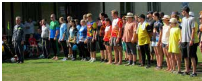
II. ročník Memoriálu „Dědy Matějůka“