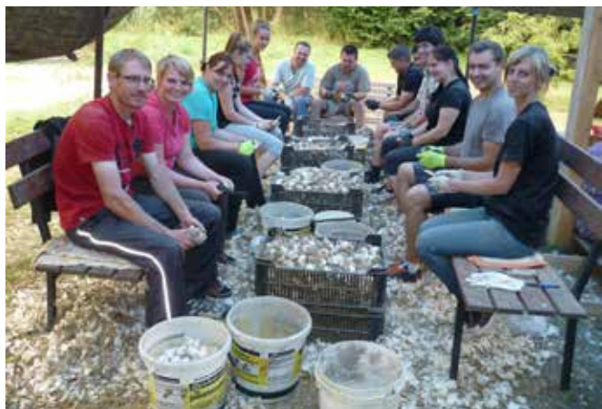
část členů SDH