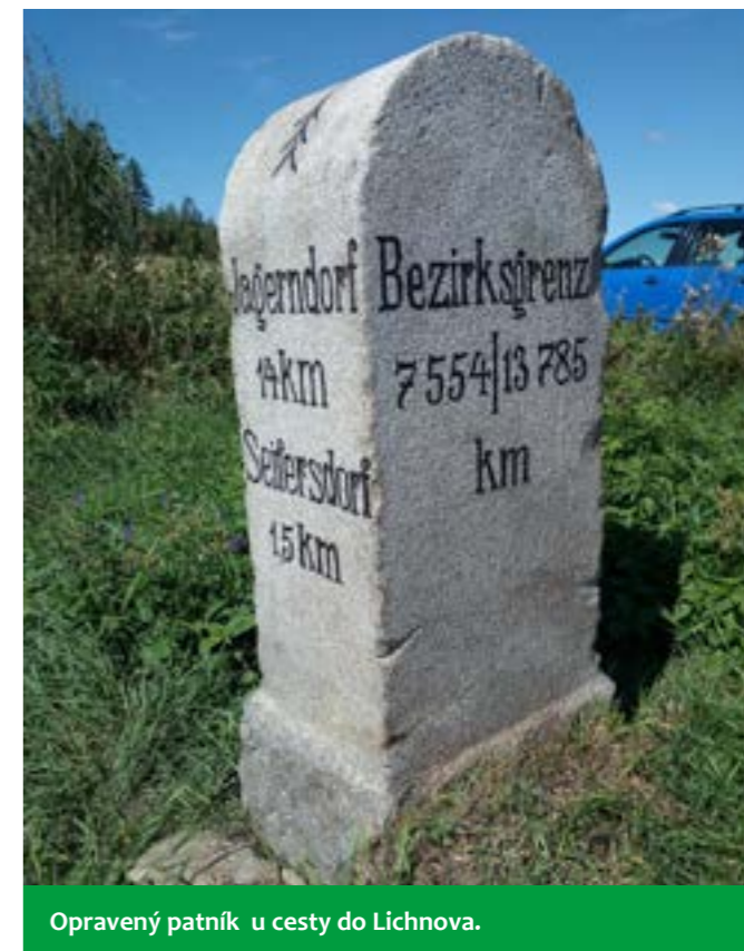
Opravený patník u cesty do Lichnova.