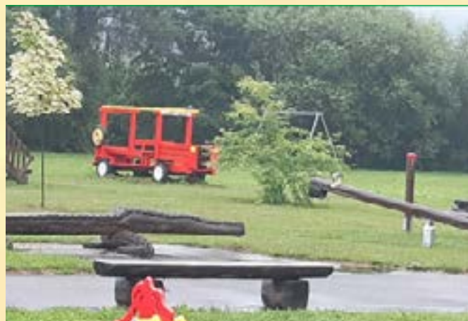
Opravené hasičské auto čeká na své malé návštěvníky. Děkujeme panu Milanu Belejovi za jeho práci.

„Člověk snáze pozná vesmír než svého souseda.“